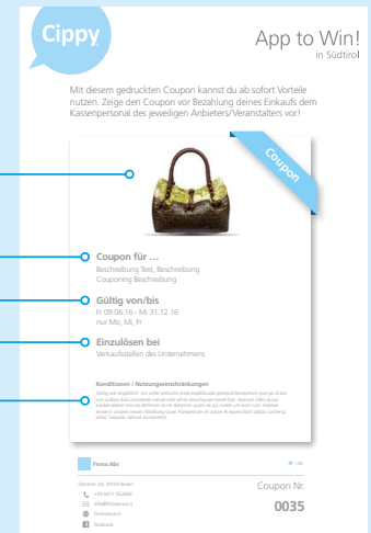
Ausdruck von Website